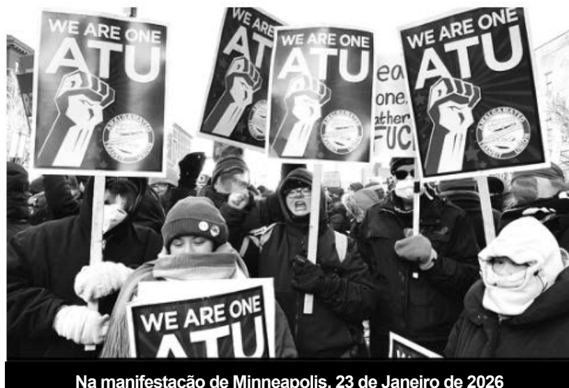
Na manifestação de Minneapolis, 23 de Janeiro de 2026

Contudo, se Trump esbarra nos limites e contradições do próprio sistema capitalista, ele esbarra igualmente na resistência operária e na luta de classes. Esta resistência reflectiu-se, nos Estados Unidos, nos movimentos de greve em que os trabalhadores, na base, se organizaram na luta pelas suas reivindicações, nas significativas manifestações de Junho e Outubro, em que os trabalhadores saíram à rua aos milhões em protesto contra a política de Trump e os ataques à democracia, na constituição de redes de organização da defesa dos trabalhadores imigrantes contra as rusgas nas cidades e nos bairros. Reflectiu-se também no mundo inteiro; nas concentrações de Junho e Julho de 2025, da Índia ao Luxemburgo, em que trabalhadores e organizações sindicais saíram à rua para protestar contra os planos dos seus governos de ao serviço do imperialismo americano. Nos levantamentos da juventude na Indonésia, no Nepal, em Madagascar, nas Filipinas, em Marrocos, contra o desemprego e a destruição dos serviços públicos — que não passam de consequências da pilhagem das potências imperialistas e do modo de produção capitalista assente na propriedade privada dos meios de produção. Reflecte-se em cada uma das greves na Europa, contra os planos de despedimentos ou os cortes orçamentais resultantes da guerra alfandegária e das ordens americanas para aumentar os orçamentos da guerra. Esta re-