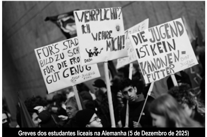
Greves dos estudantes liceais na Alemanha (5 de Dezembro de 2025)

(2) O SPD é o partido social-democrata alemão