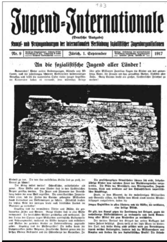
Primeira página da Jugend-Internationale (1917)

É próprio da burguesia desenvolver grandes grupos económicos, atirar para as fábricas crianças e mulheres, ali as martirizar e perverter, votá-las ao pior despojamento. Nós não “reivindicamos” este tipo de desenvolvimento, não o “apoiamos”, lutamos contra ele. Mas como lutamos? Sabemos que os grupos económicos e o trabalho das mulheres nas fábricas marcam um progresso. Não queremos andar para trás, voltar para o artesanato, para o capitalismo pré-monopolista, para o trabalho