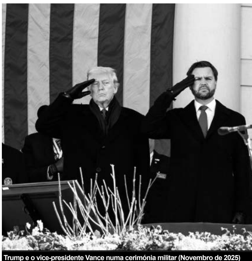
Trump e o vice-presidente Vance numa cerimónia militar (Novembro de 2025)

Em nem um ano, Trump abanou todos os quadros existentes e as relações entre governos, imperialistas ou não. Como escrevemos no Verão de 2025, “a política levada a cabo por Trump em 2025 não se pode desenquadrar da curva que o sistema capitalista descreve há dois séculos: entre a sua afirmação, o seu desenvolvimento e alargamento ao mundo inteiro e, depois, a estagnação, entrando então no caminho do declínio e caíndo no beco sem saída da decomposição e putrefacção. (...) Com todos os delírios e ultrajes próprios da personagem (e, porventura, em parte por causa deles) Trump é, para o capital, o