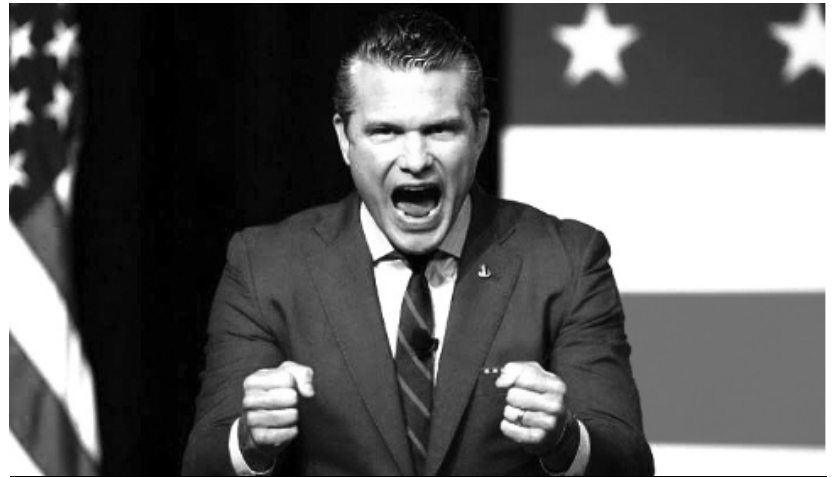
Hegseth, secretário da Guerra, discursando aos generais (Setembro de 2025)

Contudo, para marchar para a guerra, o imperialismo necessita de um tipo de exército que já não coincide com o que existiu na