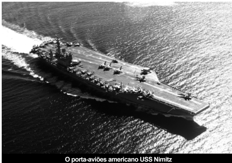
O porta-aviões americano USS Nimitz

Houve outros mercados que se abriram, como o da guerra espacial. Se bem que disponha apenas de 3% do orçamento total, ele é beneficiário prioritário dos novos recursos, tendo necessidades estimadas em trinta mil milhões de dólares adicionais para conseguir superioridade no espaço e neutralizar as capacidades anti-satélite da China ou da Rússia.