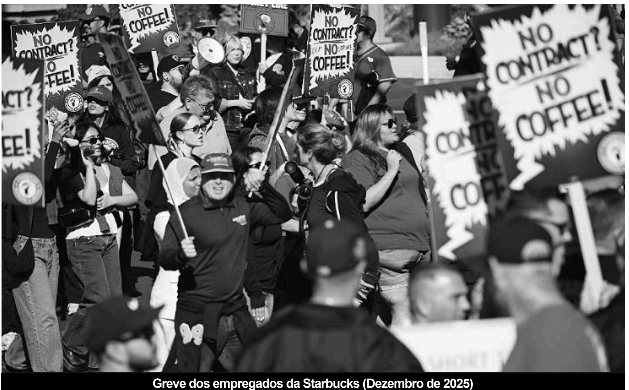
Greve dos empregados da Starbucks (Dezembro de 2025)

Ao que acresce a exclusão, na prática, de muitos trabalhadores do mercado de trabalho (desempregados de longa duração com direitos a caducar, trabalhadores desanimados) ou da possibilidade de arranjar trabalho a tempo inteiro. Acrescentando estas categorias de trabalhadores aos desempregados oficialmente recenseados, chega-se a uma taxa de desemprego real