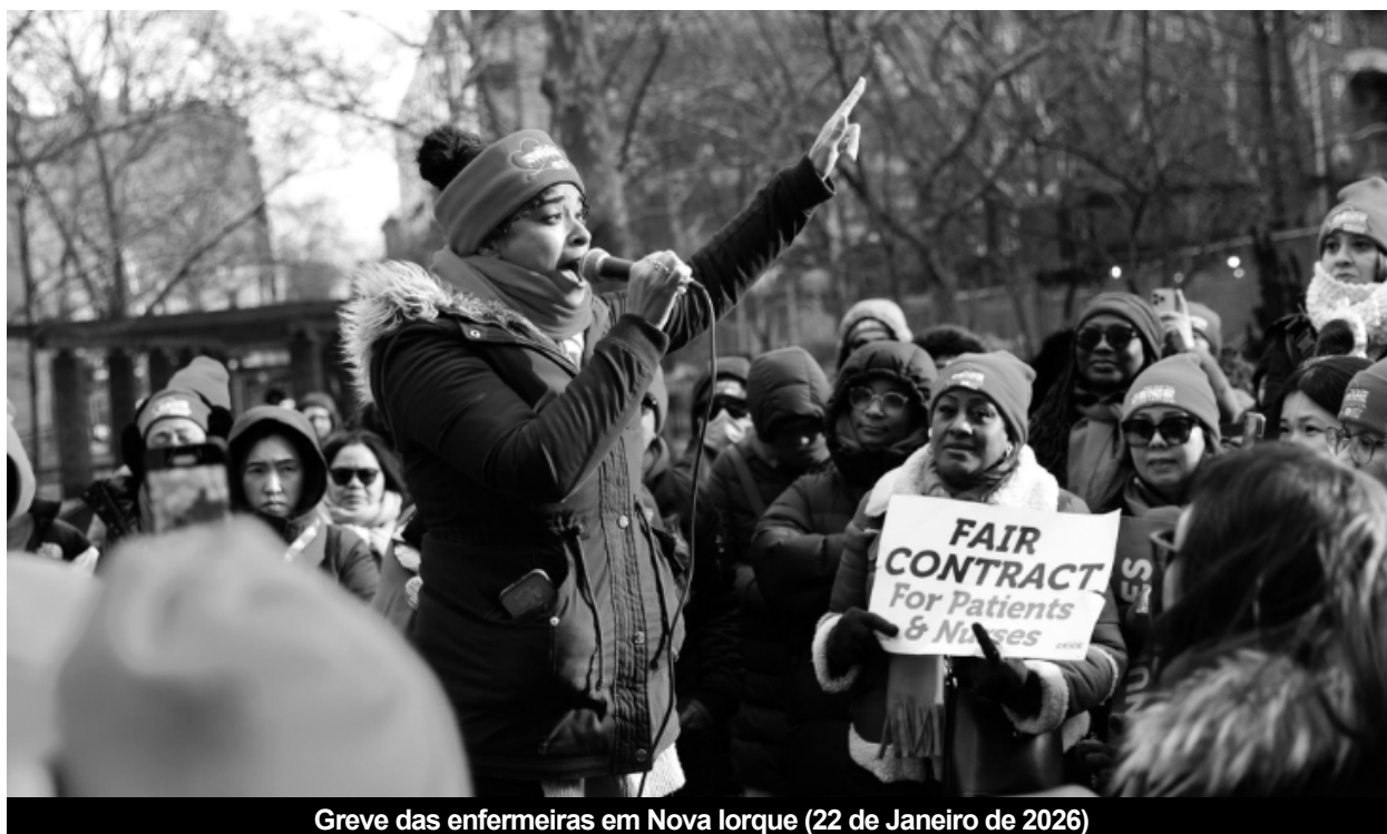
Greve das enfermeiras em Nova Iorque (22 de Janeiro de 2026)

O One Big Beautiful Bill Act prevê aumentos da despesa para a guerra e para a perseguição e expulsão de imigrantes: 150 mil milhões de dólares em despesa militar adicional e 129 mil milhões para reforço da vigilância das fronteiras e para recrutamento, nomeadamente, da sinistra polícia anti-imigração ICE ((Immigration and Customs Enforcement). Ao que se soma o orçamento militar para 2026, no valor de 901 mil milhões de dólares, que Trump conseguiu que o Congresso aprovasse no final de 2025, com a ajuda dos deputados democratas.