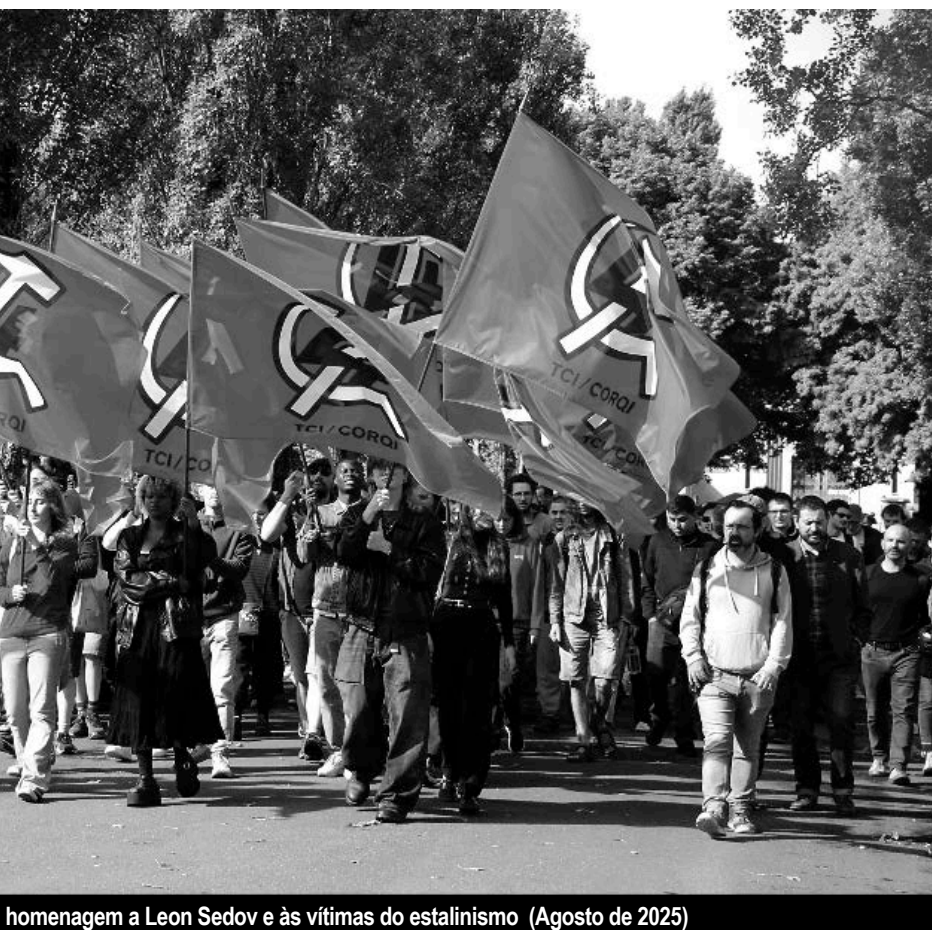
homenagem a Leon Sedov e às vítimas do estalinismo (Agosto de 2025)

Fazia-se isto em nome de uma deformação da linha da transição. Lucien Gauthier reflectia assim essa deformação: “Definir as condições concretas da construção do partido revolucionário hoje implica apreender os desenvolvimentos actuais da luta de classes (...). Pierre Lambert desenvolveu uma orientação que leva em linha de conta os processos reais na luta de classes: a transição em matéria de construção