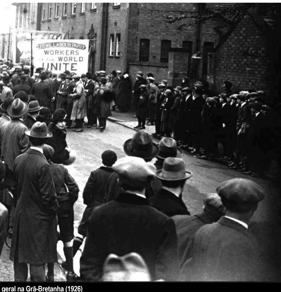
geral na Grã-Bretanha (1926)

Em 1929, em "A Internacional Comunista depois de Lenin" , Trotsky faz o balanço: "O ponto de partido do Comité Anglo-Russo era, como vimos, uma aspiração impaciente a saltar por cima do jovem Partido Comunista, que só se desenvolvia muito lentamente."