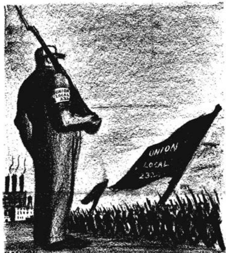
“Treino militar à nossa modal!”. Cartaz do SWP pela formação militar sob direcção das organizações sindicais