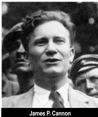
James P. Cannon

– Qual foi o objectivo fundamental que o congresso, o congresso de fundação do Socialist Workers