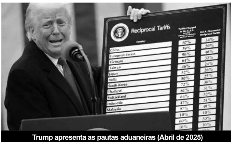
Trump apresenta as pautas aduaneiras (Abril de 2025)

Nestas condições, os direitos aduaneiros renderam ao orçamento federal receitas de 195 mil milhões de dólares, o dobro do valor de 2024, mas equivalentes a apenas 8% do montante do imposto sobre os rendimentos dos contribuintes americanos. Mais, enquanto Trump apostava em direitos aduaneiros médios de 33%, cálculos recentemente efectuados por economistas de Harvard e da Universidade de Chicago mostram um resultado, no final do ano, de 14% (4) .