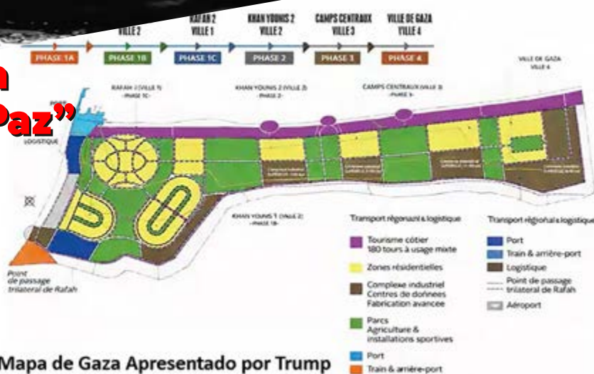
O Mapa de Gaza Apresentado por Trump

O que, sim, está previsto é a construção de uma base militar americana. Segundo planos vistos pelo jornal britânico The Guardian (19 de Fevereiro), a base ficará “ cercada por 26 torres de vigia blindadas móveis, com campo de tiro, bunkers e um depósito para equipamento militar operacional. Toda a base ficará cercada por arame farpado ”. Este plano foi divulgado com a