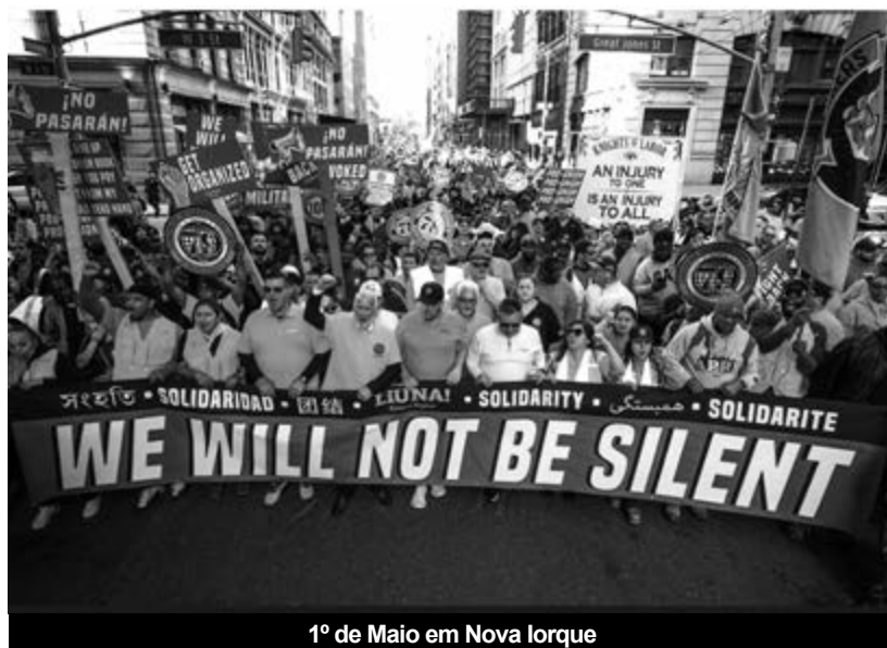
1º de Maio em Nova Iorque

A GUERRA NO IRÃO, começada no dia 28 de Fevereiro, não parou, desde esse mesmo dia, de agravar a crise política com que a administração Trump se confronta praticamente desde a posse. Contrariando as expectativas de Trump, que gostaria de ter conseguido desviar a atenção dos maus resultados da sua política económica e da sua implicação no caso Epstein, a guerra nunca contou, desde que começou, com grande apoio na população. Logo no primeiro dia dos bombardeamentos, houve manifestações em setenta cidades de todo o país, reunindo milhares de participantes, que entoavam «Não queremos outra guerra americana no Médio Oriente!», «Deixem o