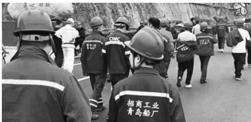
Manifestação de grevistas dum estaleiro naval, reclamando salários, 19 de Junho de 2025

O Comité de Organização pela Reconstituição da IV a Internacional não pode, porém, ficar