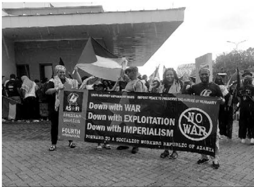
Militantes da IVª Internacional numa manifestação em Joanesburgo em 2024

parceiro subalterno; e mantendo sempre a firmeza política.