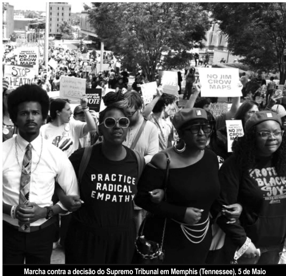
Marcha contra a decisão do Supremo Tribunal em Memphis (Tennessee), 5 de Maio