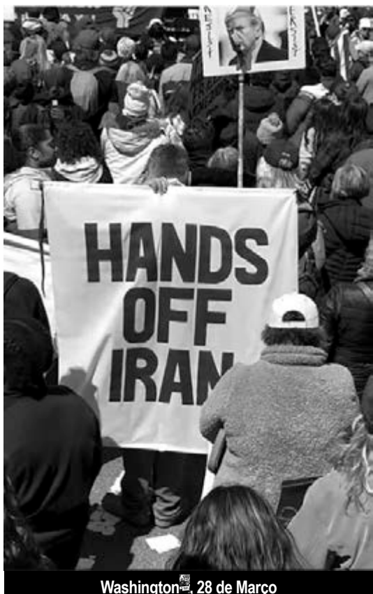
Washington, 28 de Março

Novembro. As eleições «intercalares» (que elegem metade dos membros do Senado e da Câmara dos Representantes) sempre foram um teste para o partido no poder, pois servem de indicador do nível de rejeição da política levada a cabo pela administração. As de 2026 não vão ser excepção. « Amplios segmentos do eleitorado de Trump desaprovam a sua acção », referiu a emissora televisiva burguesa CNN no passado dia 14 de Abril. Quanto mais se aproximam as eleições, mais vozes dissidentes se fazem ouvir na parte de Trump. Muitos membros do Congresso receiam agora que o serem associados à actual administração prejudique a sua reeleição.