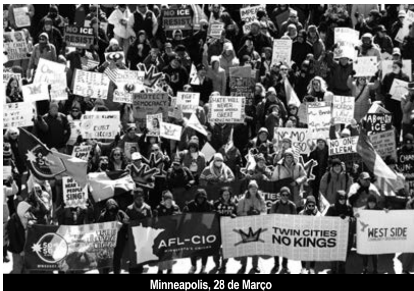
Minneapolis, 28 de Março

A 28 de Março, correu a terceira edição das manifestações «No Kings» (2) por todo o território dos Estados Unidos. No entanto, muito mais do que nas anteriores, os sindicatos tiveram lugar de destaque na mobilização. Muitos foram os que apoiaram os apelos à jornada de luta e marcaram presença com cortejos organizados que eram portadores