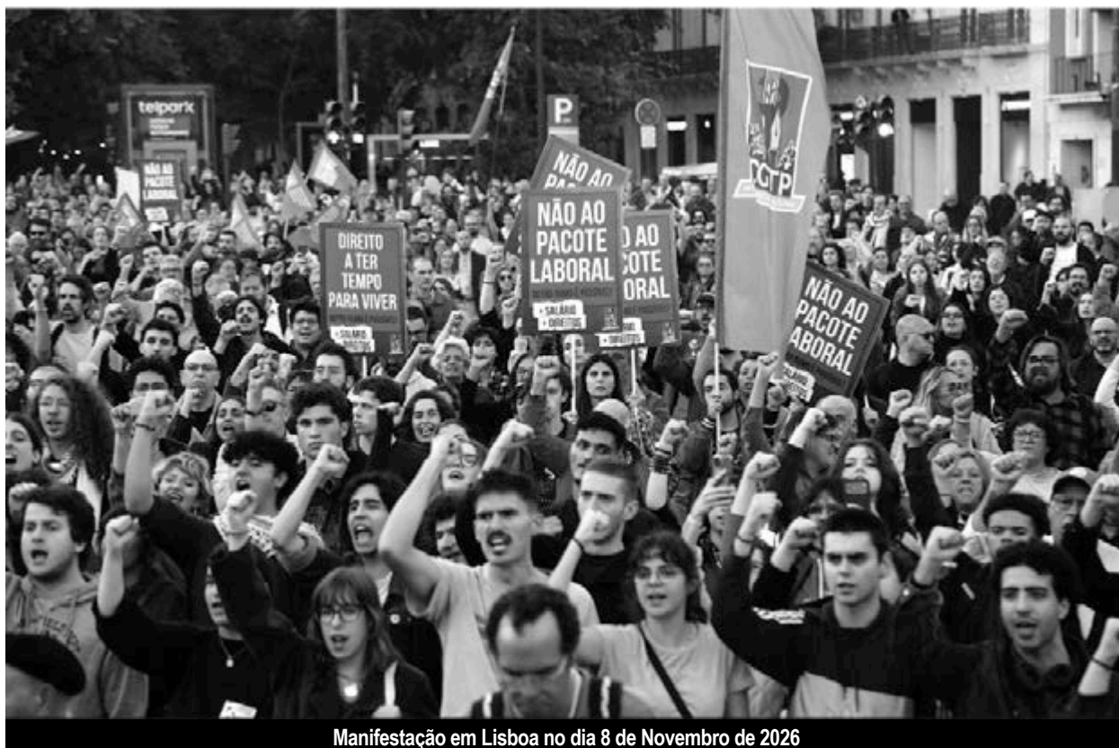
Manifestação em Lisboa no dia 8 de Novembro de 2026

Mas a prova está dada: quando, como foi o caso na greve geral e nas manifestações de Abril, não há obstáculos aparentes à unidade, e as direcções não praticam o sectarismo e a divisão, as massas laboriosas dizem presente.