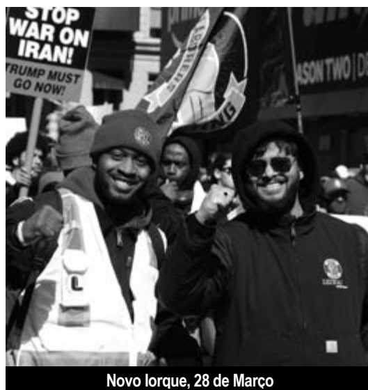
Novo Iorque, 28 de Março

Às manifestações de 28 de Março seguiram-se as do 1º de Maio, ainda mais massivas. Merecem destaque vários aspectos deste dia de mobilização. Tradicionalmente, nos Estados Unidos o 1º de Maio não tem o mesmo significado que no resto do mundo (o Labor Day americano celebra-se na primeira segunda-feira de Setembro). Não é, portanto, despiendo que, dando continuidade ao crescendo da mobilização contra Trump e a sua política, os sindicatos ten-