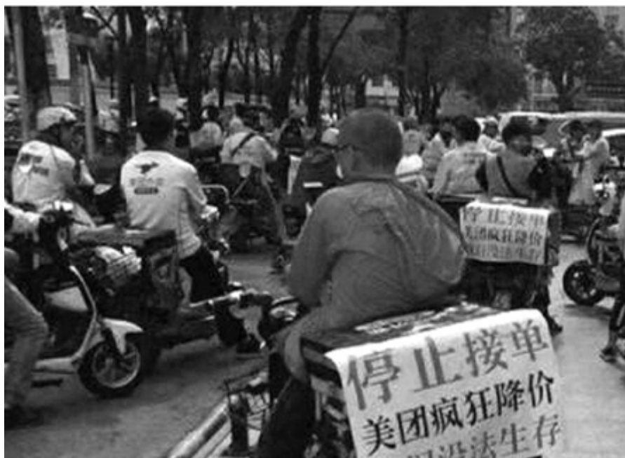
Greve de estafetas em cinco grandes cidades, em 2019

desenvolvido rapidamente nos últimos dez anos no sector das novas tecnologias. A participação de capitais privados nas empresas públicas é minoritária, mas tem aumentado. A cotação em bolsa de muitas empresas públicas e o seu alinhamento crescente com os modelos de gestão capitalistas fazem investidores internacionais, como a seguradora Allianz, afirmar que «podem oferecer excelentes oportunidades aos investidores», dada «a diminuição do peso da dívida, a generalização de programas de participação accionista para dirigentes e funcionários, a melhoria dos fluxos de caixa e a ênfase crescente no rendimento dos accionistas, graças a dividendos mais elevados e à recompra de acções» (página em linha da Allianz Global Investors ).