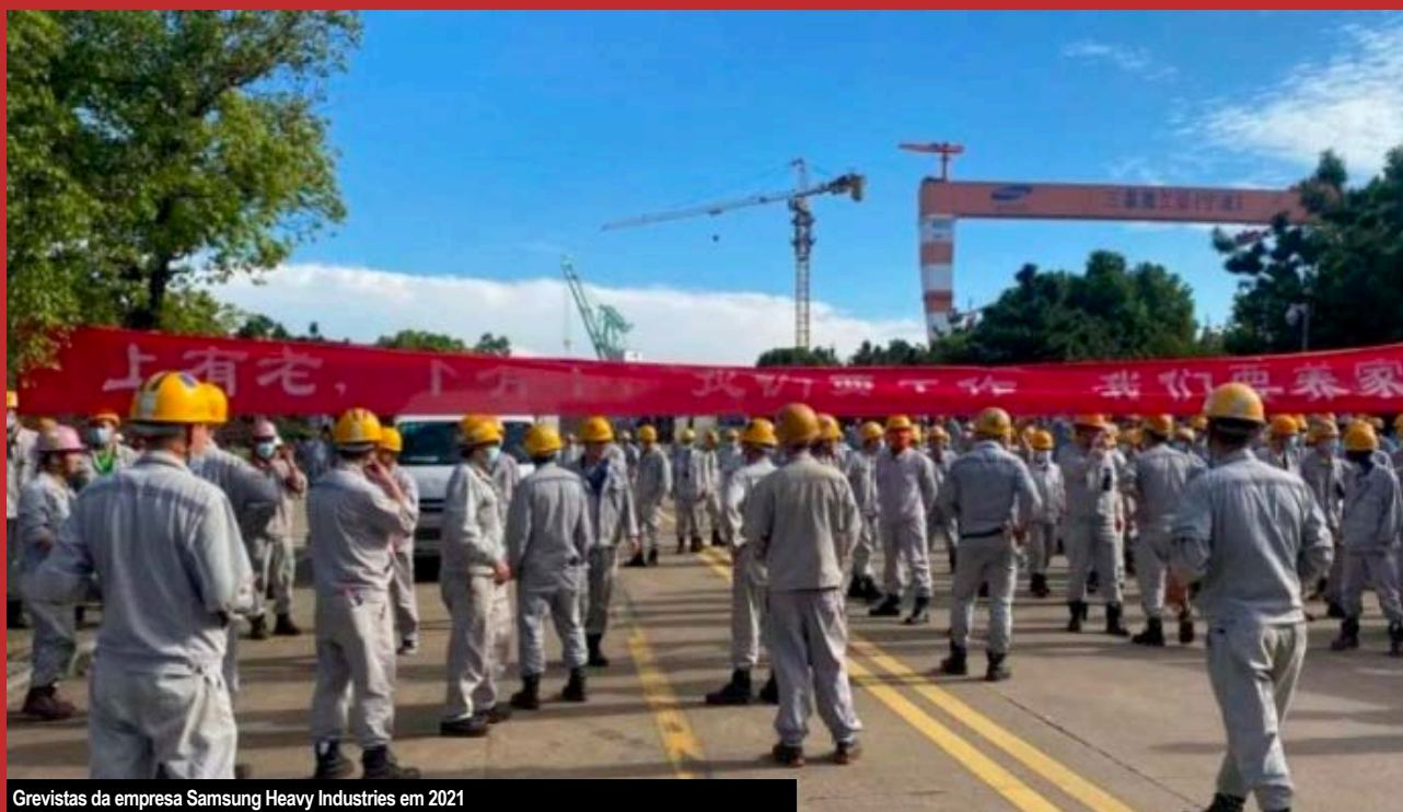
Grevistas da empresa Samsung Heavy Industries em 2021