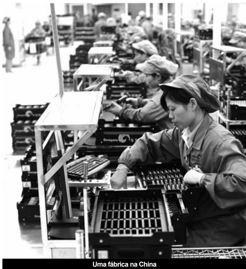
Uma fábrica na China

e, posteriormente, de multinacionais americanas e europeias, contribuindo para a baixa geral dos salários à escala internacional. Segue-se a adesão à OMC, em 2001, a compra maciça de títulos do Tesouro americano e, finalmente, a contribuição para a estabilização da situação mundial durante a crise de 2008, com um plano de relançamento da economia chinesa no valor de 450 mil milhões de euros e ajudas financeiras ou industriais a vários países da Europa (Espanha, Portugal, Grécia...).