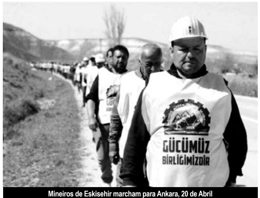
Mineiros de Eskisehir marcham para Ankara, 20 de Abril

O governo proibiu as manifestações do 1º de Maio na praça Taksim, em Istambul, mas