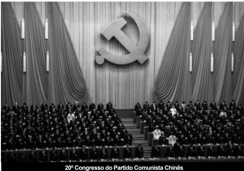
20º Congresso do Partido Comunista Chinês

Os capitalistas estrangeiros não têm a mínima ilusão de que assim é. Num longo relatório de