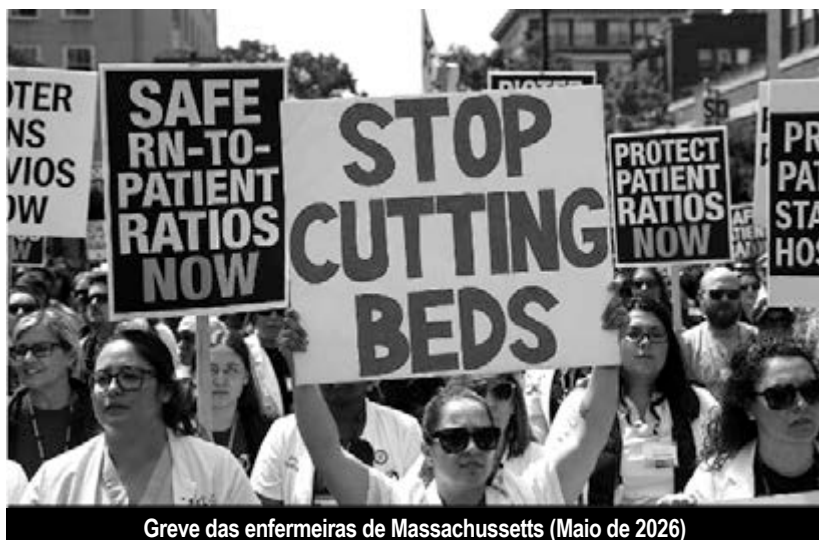
Greve das enfermeiras de Massachussetts (Maio de 2026)