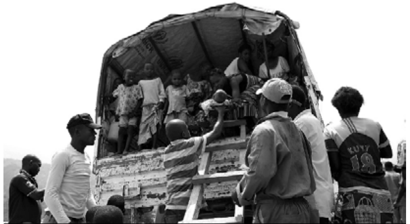
Refugiados na região do Kivu Sul (República Democrática do Congo)

Batido, em 2013, pelas tropas da ONU (MONUSCO) e por uma aliança internacional que apoia as forças armadas da RDC,