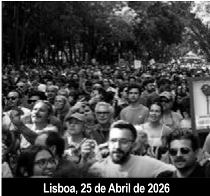
Lisboa, 25 de Abril de 2026

Durante dez anos, desde 2015, governos “de esquerda” que dispunham de larga maioria, dirigidos pelo PS com o apoio directo ou indirecto do PCP e do Bloco, seguiram escrupulosamente as instruções de Bruxelas em matéria de redução do défice orçamental e da dívida pública — à custa dos trabalhadores. Acrescente-se que a taxa de sindicalização tem baixado nas últimas décadas, principalmente no sector privado. As acções sindicais, em todo o caso as acções unilaterais de cada uma das centrais sindicais, a CGTP, largamente controlada pelo Partido Comunista, e a UGT, cuja direcção é maioritariamente próxima do PS, tiveram resultados limitados na luta contra a ofensiva sobre as conquistas e direitos dos trabalhadores. Enquanto a direcção da UGT se compromete em concertações e negociações sem fim com o patronato e o governo para evitar a todo o custo ter de lutar, a da CGTP organiza manifestações fortemente enquadradas e ritualizadas em jornadas de luta sem amanhã, que dividem mais do que unem.