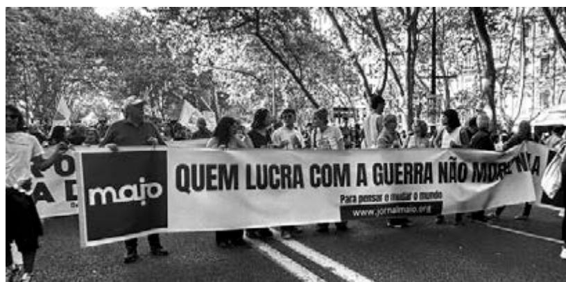
Manifestação em Lisboa no dia 25 de Abril de 2026

Recordemos os seus elementos essenciais: assiste-se, há alguns anos, a uma brutal queda eleitoral dos partidos que constituem a representação política da classe trabalhadora e da juventude em Portugal (PS, PCP, Bloco de Esquerda). Paralelamente, a votação na direita aumentou significativamente — sobretudo a votação na extrema-direita neofascista.