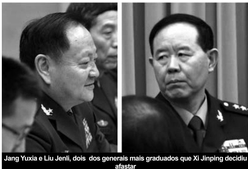
Jang Yuxia e Liu Jenli, dois dos generais mais graduados que Xi Jinping decidiu afastar

A burocracia chinesa abriu o país à penetração capitalista. Abriu às escâncaras o caminho para se poder formar e, a seguir, desenvolver uma burguesia chinesa que dispõe de poder económico crescente e, impulsionada pelo imperialismo americano, se verá inevitavelmente na